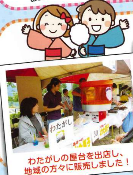
わたがしの屋台を出店し、地域の方々に販売しました!