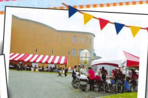
上志比文化会館サンサンホールは盛り上がりおりました!

永平寺ハウスでは、毎年、永平寺町で開催されている「ふれあいフェスタ」に屋台を出し、参加させていただいております。