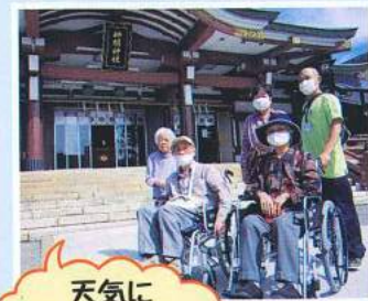
天気にも恵まれました！