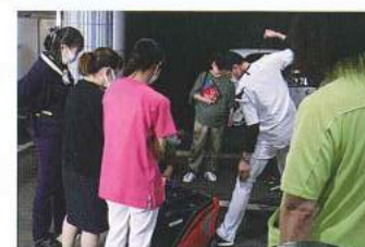
電源を入れる為に発電機の線を引っ張る様子

永平寺ハウスでは、去年の大雪を踏まえて防災委員会を中心に災害に備えています。災害はいつ遭遇してもおかしくはありません。利用者様の生活を守るための対策を一部ですが紹介します。