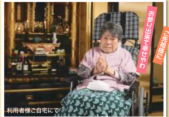
利用者様ご自宅にて

本企画が実現出来たのは、ある利用者様の「家に帰って仏壇参りと家族に逢いたい」との切なる申し出がきっかけでした。沢山の利用者様が「コロナ感染予防のため」という理由により、対面での面会が出来ないことや、外出自粛も仕方ないこと、とても我慢されているのを思うと、いつも胸が痛んでいました。今回の一時帰宅が実現し、改めて利用者様の思いに添える事でスタッフも充実感や、やりがいを感じることが出来る素晴らしい機会に立ち会えることが出来て深く感謝しています。