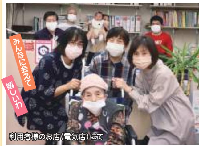
利用者様のお店(電気店)にて

今回で4回目となりました故郷訪問。コロナ禍で中止となつて久しいこのプロジェクト。長い自粛期間が続き、面会もままならない状況に、利用者様のメンタルを心配する声もありました。そして今回、利用者様の「帰りたい」という思いに少しでも応えさせていたきたい、との願いで復活する事が決定し、感染症対策を徹底しての訪問となりました。懐かしいご自宅やご家族との再会に感極まるシーンもあり、安堵された様子や喜びの声も聞かせていただくことが出来ました。