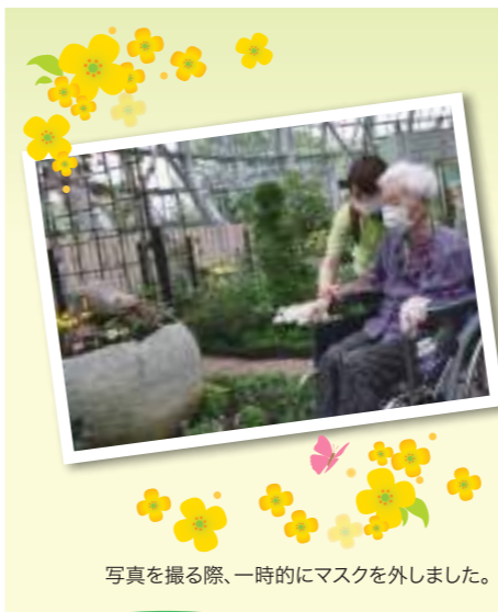
写真を撮る際、一時的にマスクを外しました。

〒910-0801 福井県福井市寺前町2-2-2 TEL0776-54-4681